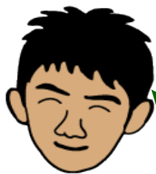
すぎもり せんせい

せんせい 先生は子どものころ、スポーツはあまり上手ではありませんでした。でもからだを動かす事は好きでした。好きなことを続けているといつのまにか体力もつき、できる事がふえていました。こんかい 今回のレッスンでみんなにもそんなけいけん 経験を一緒に共有したいとおもいます。